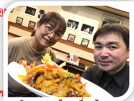
ร้านอาหารไทยเพื่อนไทย (kinchicho)