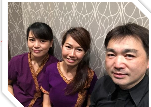
ร้านนวดแผนไทย Chorfa (จ.โอค

Q4: ช่วยบอกความเปลี่ยนแปลงอย่างละเอียดอย่างเช่นจำนวนลูกค้าหรือยอดขายที่เพิ่มขึ้นได้ไหมครับ