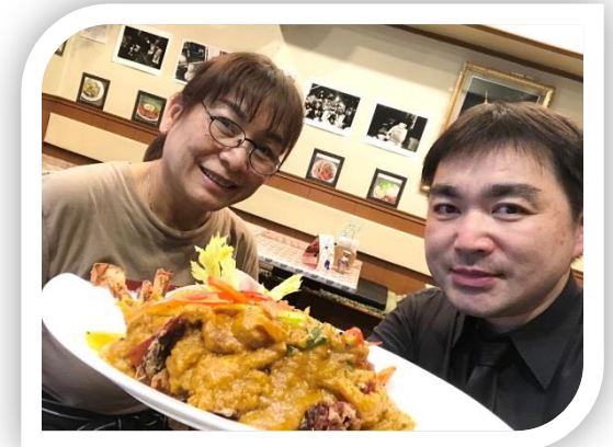
タイ料理屋 プアantai様（錦糸町）