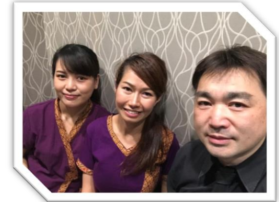
タイマッサージ チョーファ様（岡山県）